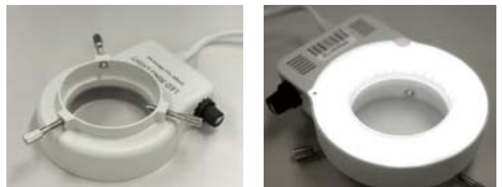
LEDリングライト (オプション) を装着することで、作業領域を明るく照明