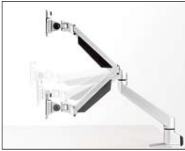
ガスシリンダーで高さ調節可能