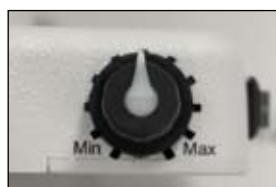
ダイヤル式の調光機能