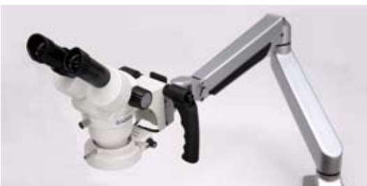
操作ハンドルを装備し、スムーズにアームの調節が可能