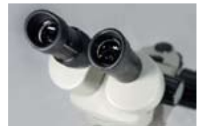
マルチコーティングレンズを搭載