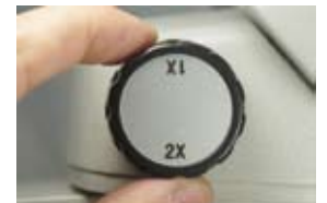
クイックにレンズの切り替えが可能