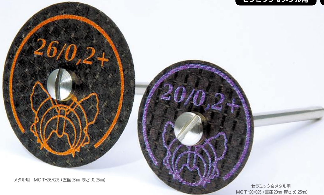
メタル用 MOT-26/025 (直径26mm 厚さ:0.25mm)