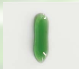
視認性に優れた ダークグリーンジェル