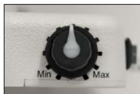
ダイヤル式の調光機能