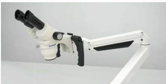
操作ハンドルを装備し、スムーズにアームの調節が可能