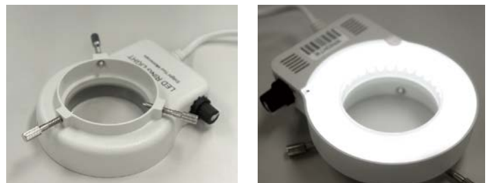
LEDリングライト (オプション) を装着することで、作業領域を明るく照明