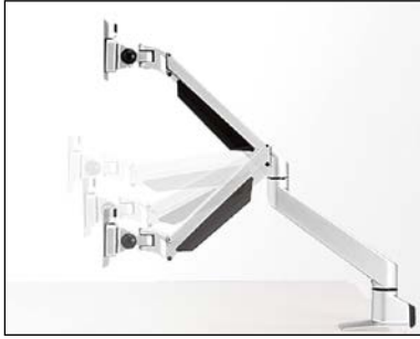
ガスシリンダーで高さ調節可能