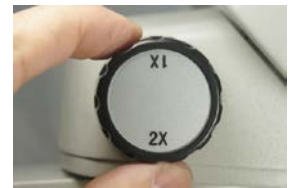
クイックにレンズの切り替えが可能