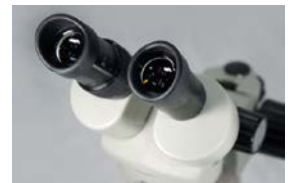
マルチコーティングレンズを搭載