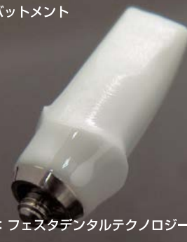
製作：フェスタデンタルテクノロジー 山口 芳正氏