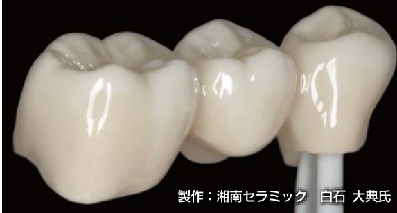
製作：湘南セラミック 白石 大典氏