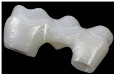
ジルコポルによる研磨前