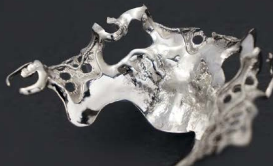
製作：有限会社カナイナビデント 金井孝行氏