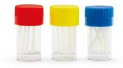
管理医療機器 認証番号:222AGBZX00195000号

高い特性を発揮する S グラスファイバーを束ね、その間に高強度のマトリックスレジンを含浸・重合させた、支台築造用ポストです。歯のたわみに応じて屈曲しながら応力を分散するため、歯への負担を大幅に軽減します。