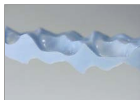
ナイフによるトリミング