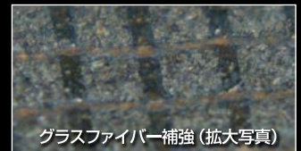
グラスファイバー補強 (拡大写真)

グラスファイバー補強により強化されたディスクだから、 切削中も、取り付け中も、割れにくい。