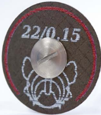
メタル用 MOT-22/015 (直径22mm 厚さ:0.15mm)