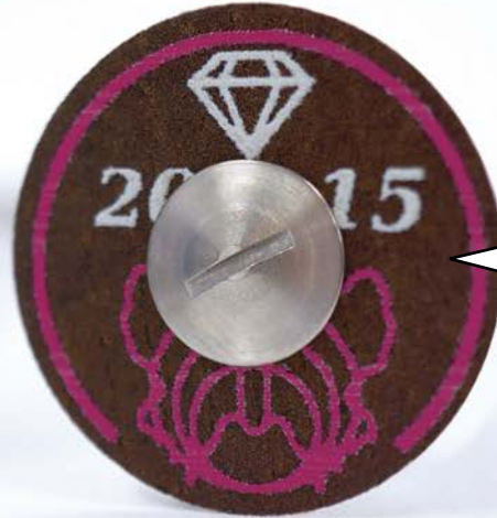
セラミック&amp;メタル用 MOT-20/015 (直径20mm 厚さ:0.15mm)